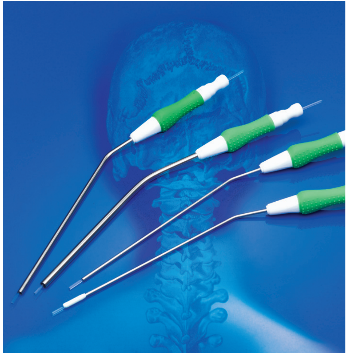
pfm Absaugkanülen für mikrochirurgische Eingriffe